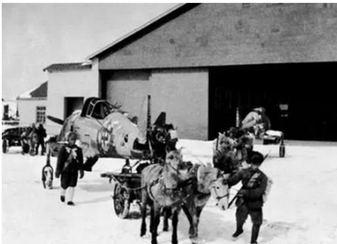
东北老航校初创时，条件极其艰辛。战士们曾用骡马拉飞机。