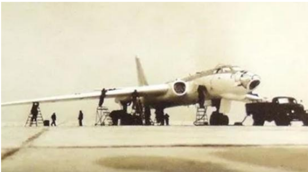
空投核武器试验前，轰6甲的地勤职员在重要准备。