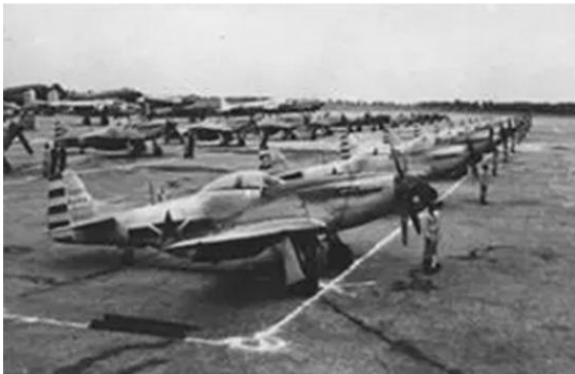
人民解放军第一支航行队——南苑航行队在北平南苑机场。图中前排是P-51D“野马”战斗机。