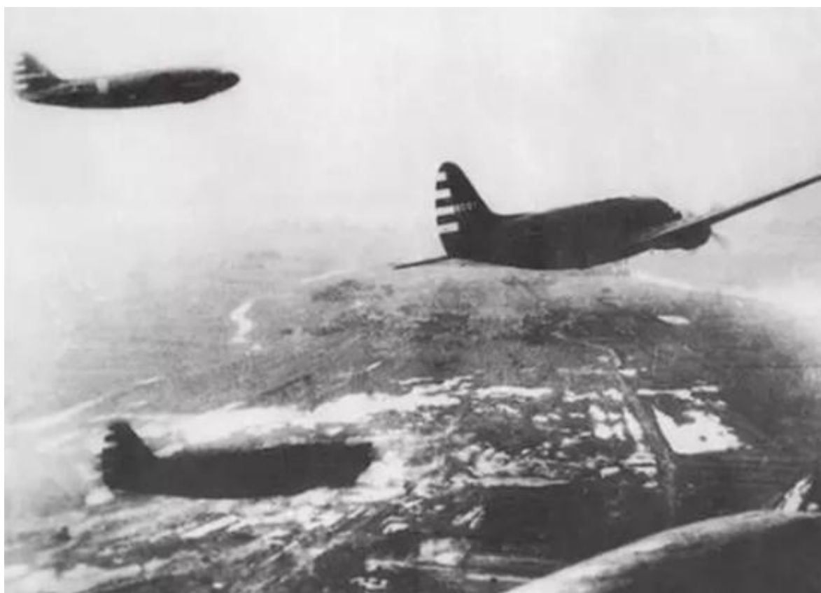
我C-46运输机编队也到场了开国大典。