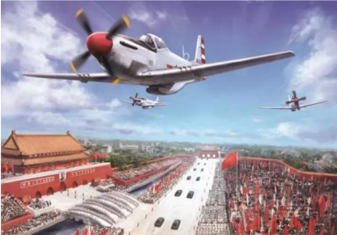
开国大典时，P-51编队飞过天安门。画家油画展现的是一个新时代的最先。