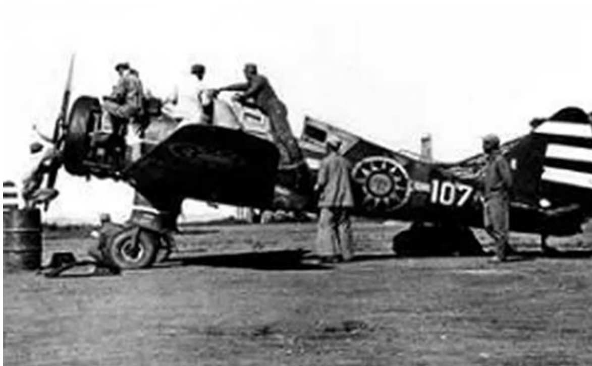
东北老航校使用缴获的日军九九高练飞机开展航行训练。